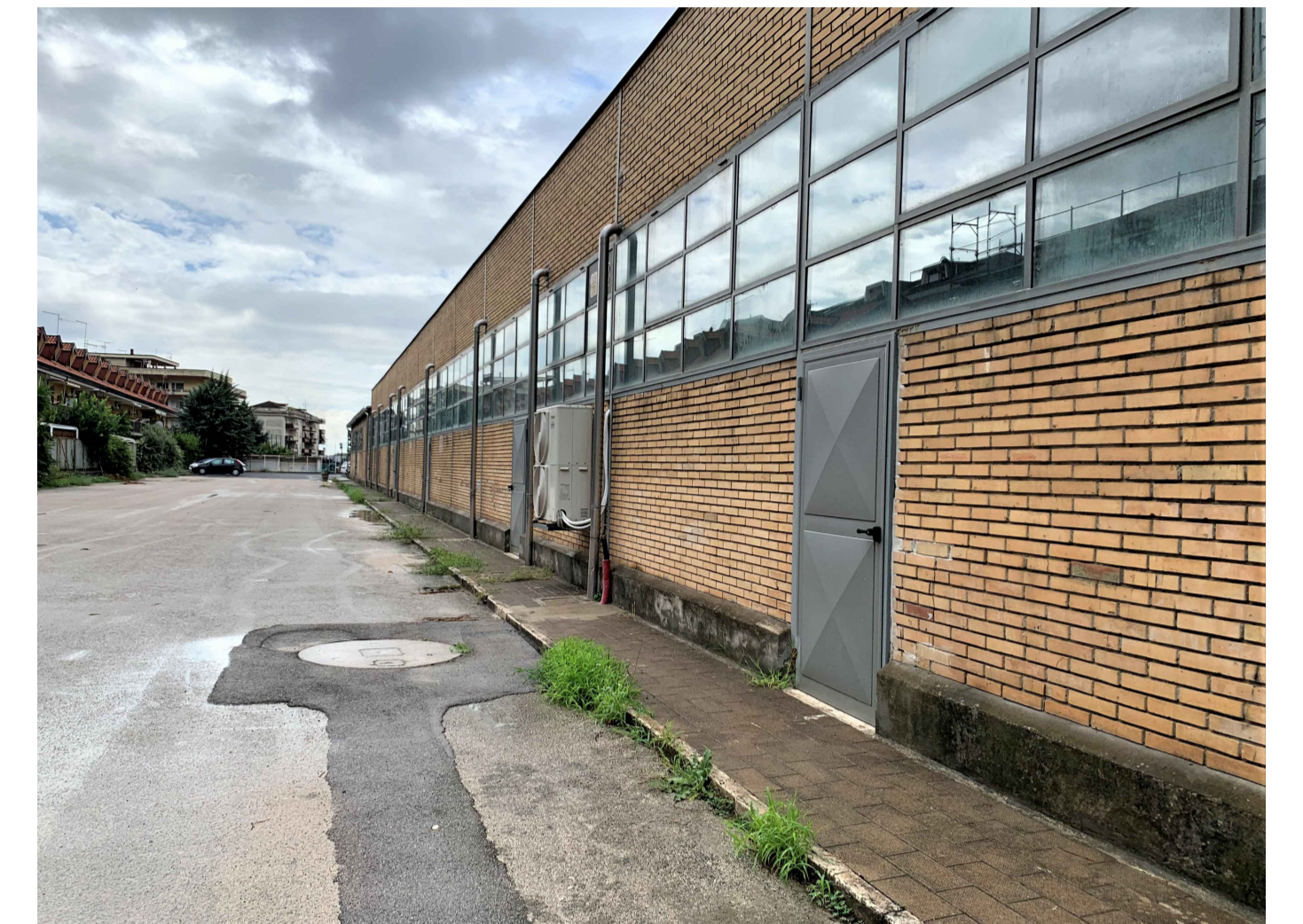
Foto esterno Prospetto Est