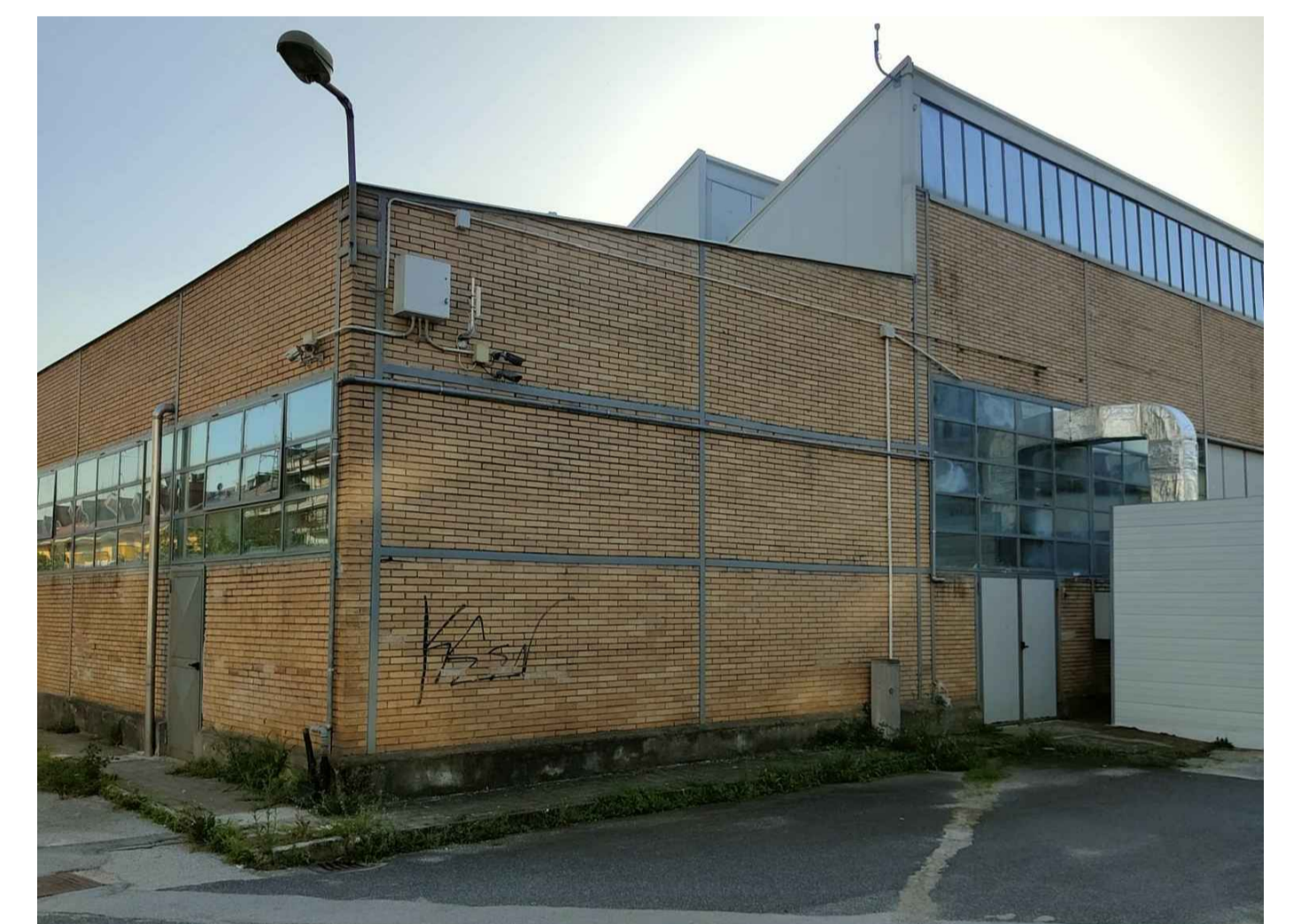
Foto esterno Prospetto Nord